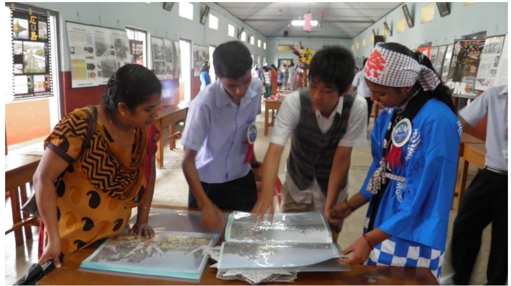
原爆展示会場及び交流会の風景