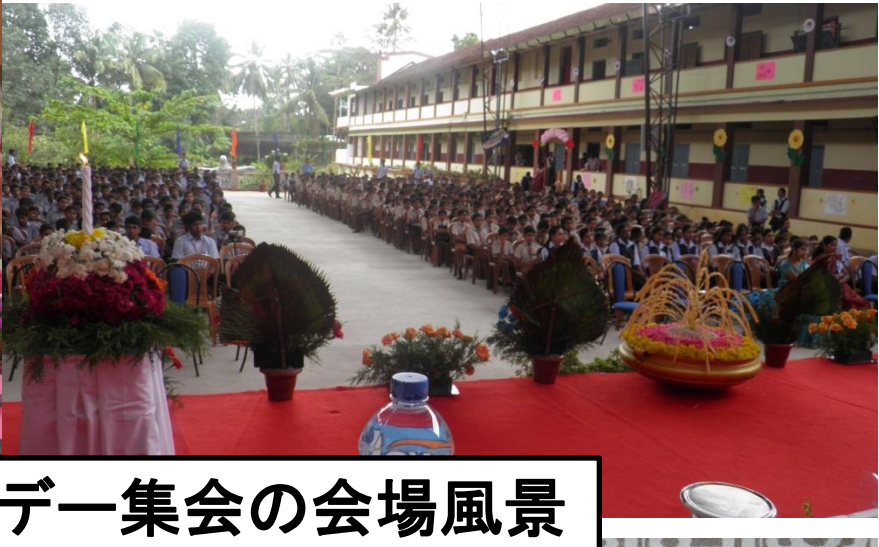
ヒロシマ・ナガサキデー集会の会場風景