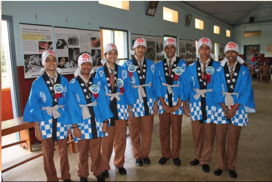
原爆展示会場の学生ボランティア:上