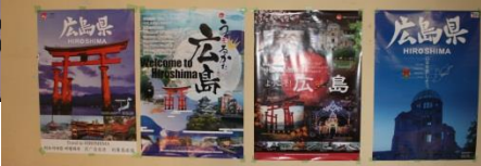
現地の取材・マスコミ報道